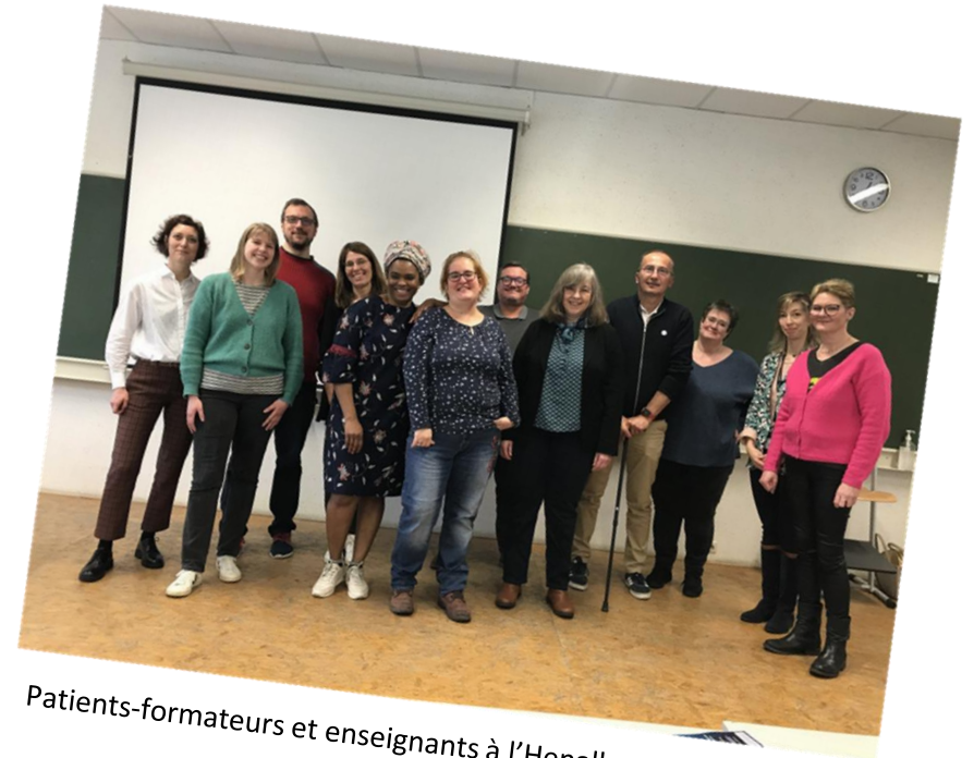
Patients-formateurs et enseignants à l'Henallux en 2023